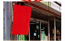
店頭の赤い旗が目印です。